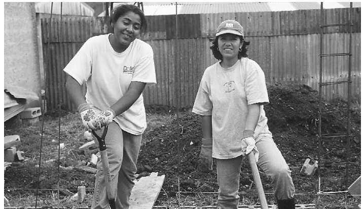
Los esfuerzos para la defensa de la causa han traído más voluntarios al terreno de construcción en AL/C.

En Estados Unidos, donde estamos acostumbrados a tener multitud de voluntarios en el terreno de