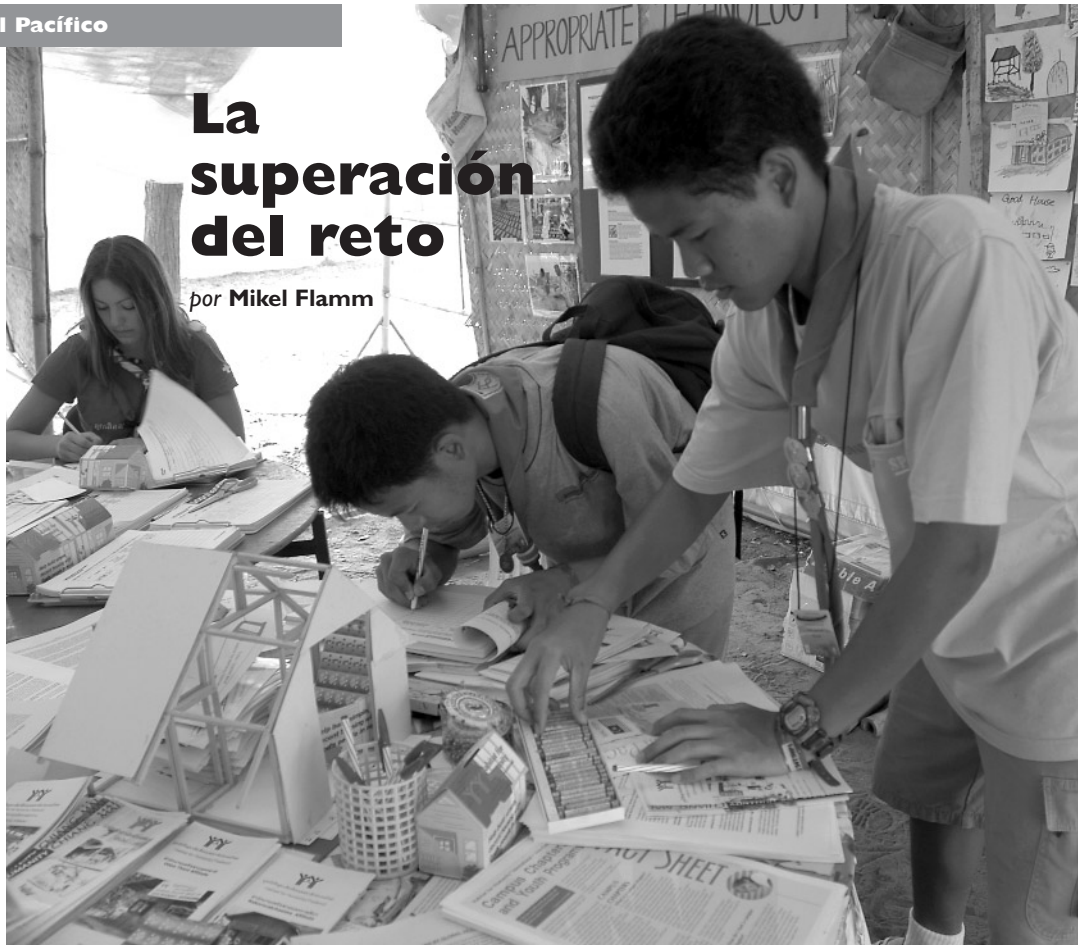
El centro de información de HPH en el World Scout Jamboree de Tailandia ofreció una excelente oportunidad para defender la visión de HPH de eliminar la vivienda infrahumana en todo el mundo.