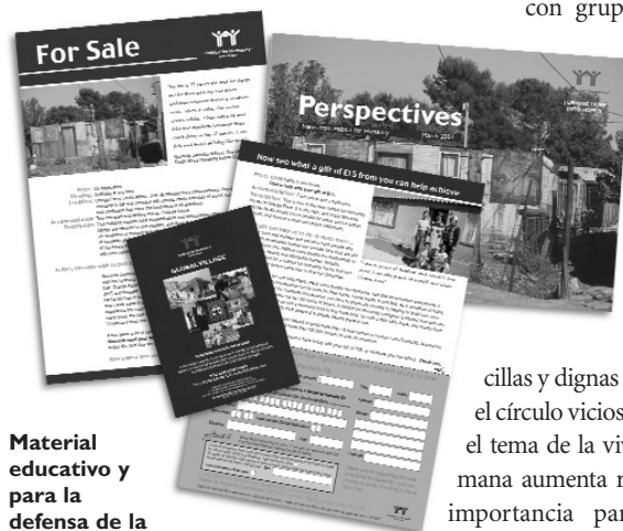
Material educativo y para la defensa de la causa creado por la oficina de HPHI Europa Occidental.

En estudios de mercado llevados a cabo en Europa Occidental, la vivienda infrahumana se sitúa por detrás de temas como la pobreza infantil o la investigación sobre el cáncer entre las prioridades del público. Esto ocurre no solo porque HPH todavía no ha dejado su marca por toda Europa Occidental, sino también -como ha indicado Millard Fuller- porque al haberse implementado fuertes políticas sociales respecto a la vivienda, en algunas partes de Europa se ha erradicado en gran medida la vivienda infrahumana. Por eso nos encontramos que tenemos que concienciar a la gente respecto a