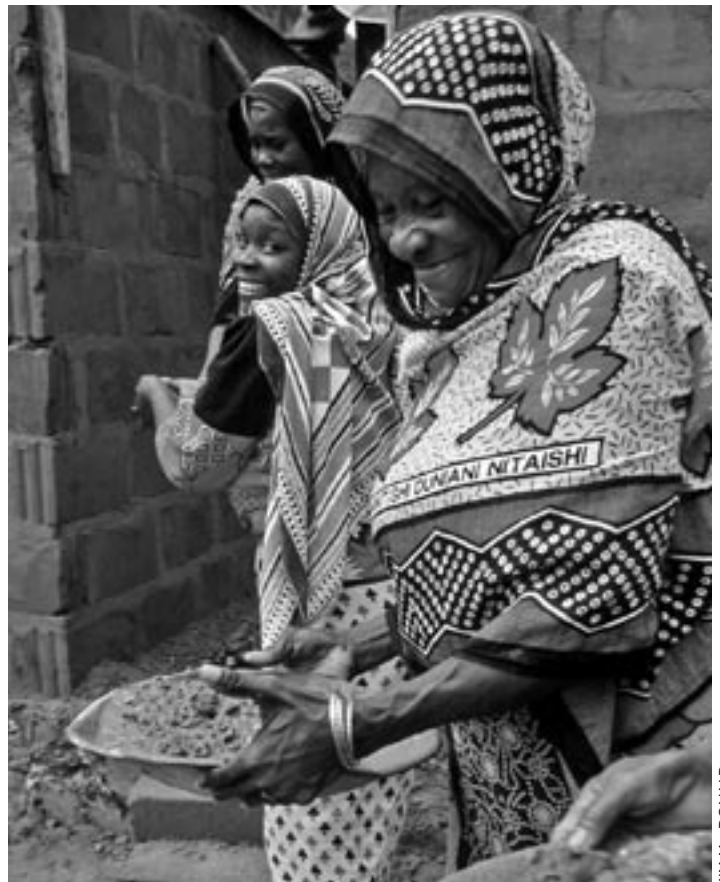
Las mujeres de la localidad se pasan argamasa unas a otras durante la construcción de cinco viviendas Hábitat edificadas mediante el proyecto "Viviendas para las mujeres tanzanas".

Aunque la legislación actual en Tanzania ofrece a las mujeres igualdad de derechos para la propiedad y el control de bienes inmuebles, la mayoría de las que viven en áreas rurales no están adecuadamente protegidas por el sistema jurídico existente. En los pueblos remotos, las normas y prácticas tradicionales continúan siendo discriminatorias contra las mujeres en materia de herencia de propiedades, especialmente en relación a los terrenos. Según las normas consuetudinarias