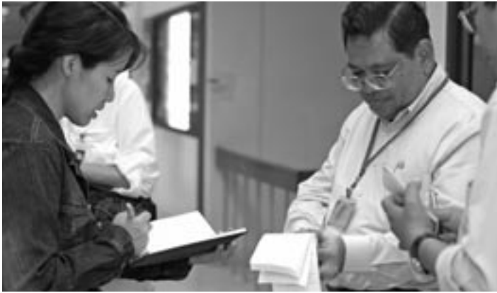
Algunos miembros del personal de Hábitat se reúnen con las autoridades del distrito en el sur de Tailandia para discutir la adquisición de terrenos para construir viviendas con las familias afectadas por el tsunami.