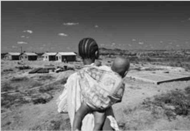
La propiedad de las viviendas produce muchos efectos positivos, especialmente para las familias encabezadas por mujeres.