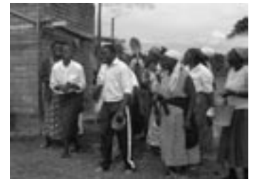
Los miembros del grupo de autoayuda Mujeres de Mosop celebran un proyecto de construcción que recibió el apoyo de la Embajada de EE.UU. y del Alto Comisionado de Canadá en Kenia.

Teniendo en cuenta que el 64% de la población vive con menos de 1 $ U.S. al día, el dinero es claramente un bien escaso entre estas mujeres. Las oportunidades de empleo son pocas e infrecuentes. Este proyecto les ofrecerá unos ingresos para sus necesidades diarias y lo suficiente para pagar la hipoteca. Casi todas las mujeres de ambos afiliados (26 casas en Tiyende Pamodzi y 56 en Nkwazi) forman parte del proyecto. Sus actividades de producción de ingresos incluyen hacer acolchados, hacer punto, coser, cultivar champiñones y hacer artesanías. Las mujeres podrán vender sus productos tanto a la gente local como internacionalmente, incluyendo los equipos de Aldea Global que visitan Zambia cada año.