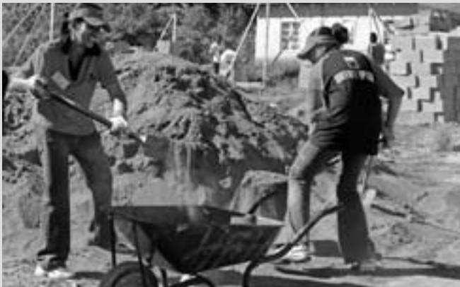
HFHSA repasa su base de datos de voluntarios antes de cada evento especial para invitar a aquéllos que trabajaron anteriormente, además de alentar el voluntariado entre los patrocinadores corporativos.

Aunque la oficina regional se ocupa de la planificación del evento, los voluntarios y la recaudación de fondos, la filial está a cargo de la preparación de la construcción. El gerente de la filial trabaja con su equipo de construcción para preparar las fundaciones. Como el terreno es irregular y está cubierto de colinas, se presta sumo cuidado para asegurarse de que las losas de hormigón sean vertidas y curadas