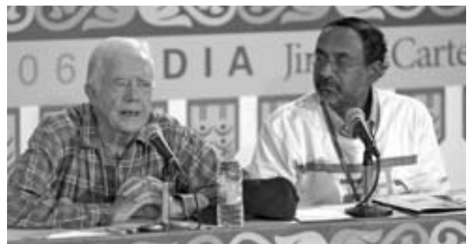
Las conferencias de prensa son vehículos importantes para comunicarse con el público. En la foto, el presidente Carter (a la izquierda) y Peter Selvarajan, Director Ejecutivo de HFH India, en una conferencia de prensa durante el Proyecto JCWP 2006 en la India.

Los socios corporativos cumplen un rol fundamental en la mayoría de los eventos especiales. Es importante encontrar la manera de reconocer su trabajo conjunto antes de y durante el evento, sin dejar de perder de vista la misión y el mensaje de Hábitat para la Humanidad en el proceso. Desarrollar y llegar a un acuerdo respecto de un plan de comunicaciones que se adecue a las metas de la organización trazará el rumbo apropiado cuando nuevos patrocinadores comiencen a participar. Sin embargo, siempre es útil incluir una sección especial en su