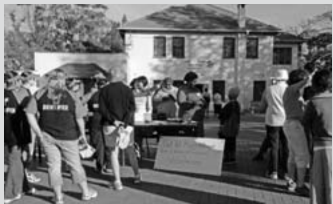
El personal, trabajadores y voluntarios, preparados para un proyecto de obra, promovido por mujeres, uno de HFH Ethembeni en el sitio de JCWP 2002 en Sudáfrica.

participó anteriormente en las obras de Ciudad del Cabo y Johannesburgo) acuerda patrocinar una junta de desayuno en Durban para sus clientes corporativos. HFH Sudáfrica (HFHSA) invita a otros contactos corporativos que parecen interesados en la obra. HFHSA ofrece una breve exposición PowerPoint y entrega folletos informativos. Luego de la junta, hace llamadas y envía mensajes electrónicos complementarios y, en algunos casos, hace una visita para brindar información adicional. En poco tiempo, 10 compañías se comprometen a participar en la obra. Otra empresa quiere participar, pero no tiene suficientes empleados para satisfacer el requisito de voluntarios. En el momento de la obra, hay interés y fondos suficientes para construir en realidad 14 casas.