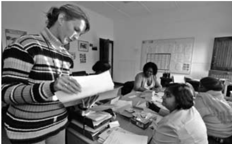
El personal de la filial de HFH en Ethembeni organiza un proyecto de obra, promovido por mujeres, en el sitio JCWP 2002.

Se arma una carpa para emergencias con paramédicos profesionales que trabajan como voluntarios cada día de la construcción; ellos tratan la mayoría de las lesiones, en general alguien que se martilló un dedo o se rasguñó una rodilla. Sin embargo, si hay una lesión grave, llamarán a una