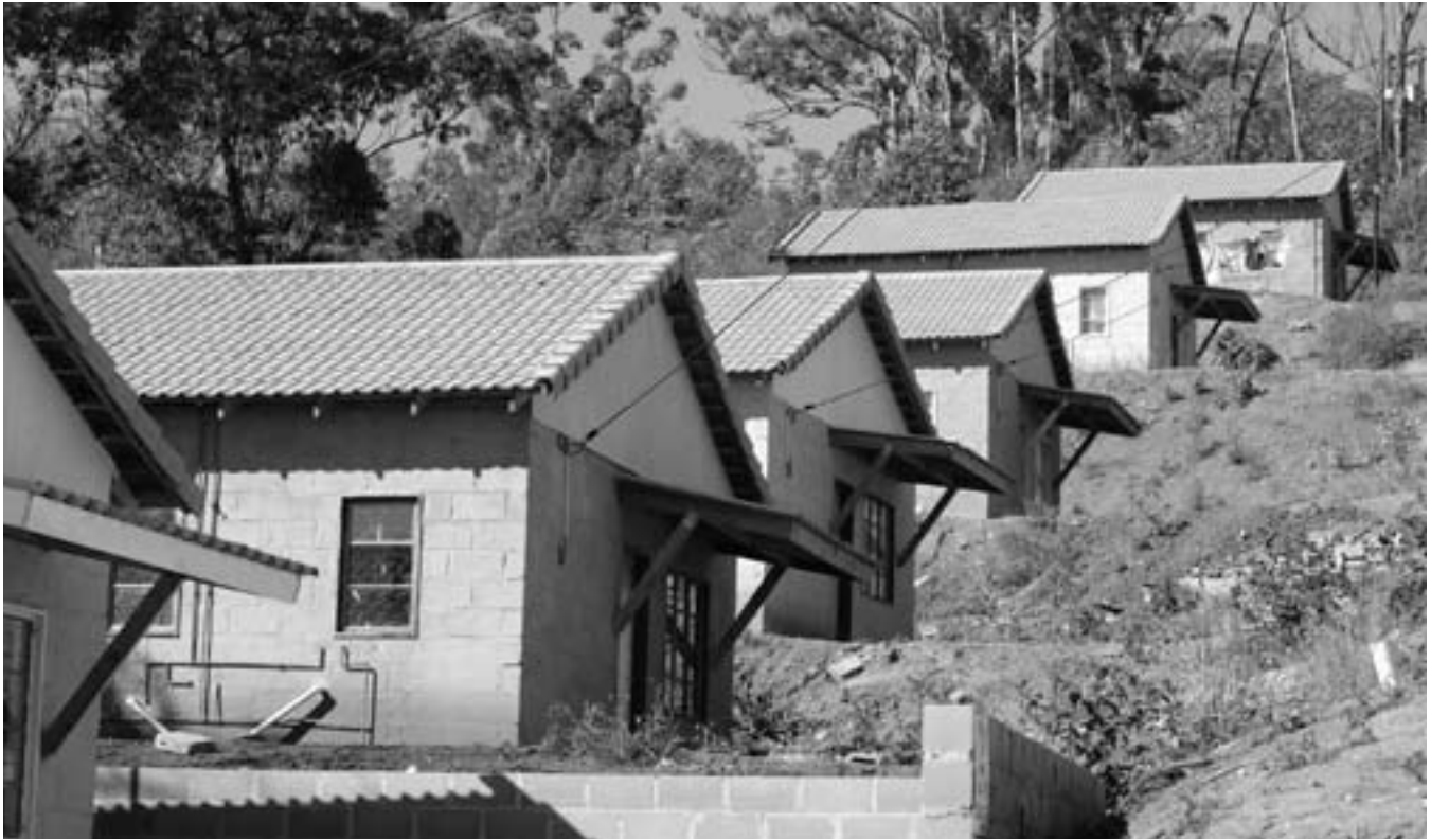
El Proyecto de Obra Jimmy Carter de 2002 sentó las bases para la adición continua de casas a este sitio de construcción en Ethebeni, Sudáfrica.