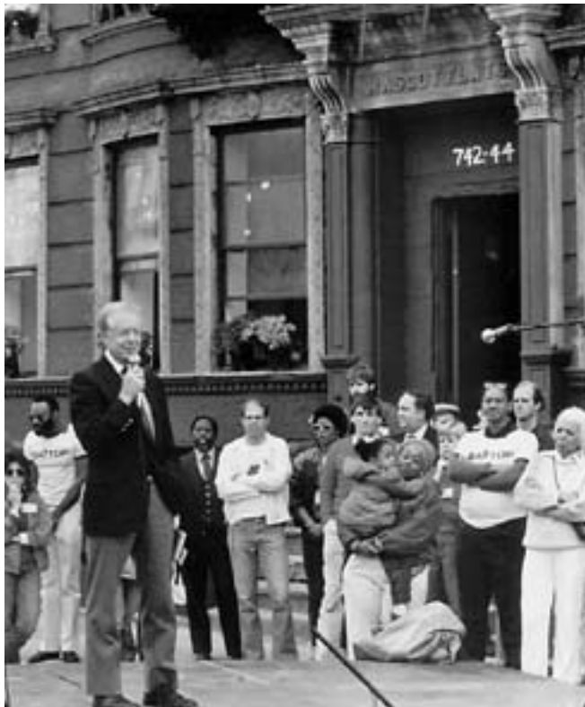
El presidente Carter en el primer Proyecto de Obra Jimmy Carter en Nueva York en 1984. Estos eventos anuales han ampliado el conocimiento sobre el trabajo de HFHI internacionalmente. Este año, el 24.º Proyecto JCWP se realizará en California, EE. UU.

El reciente trabajo realizado para actualizar el valor de la marca de Hábitat para la Humanidad, por un valor de tres mil cien millones de dólares estadounidenses ahora, confirmó lo que habíamos sospechado por años. Convoque a la