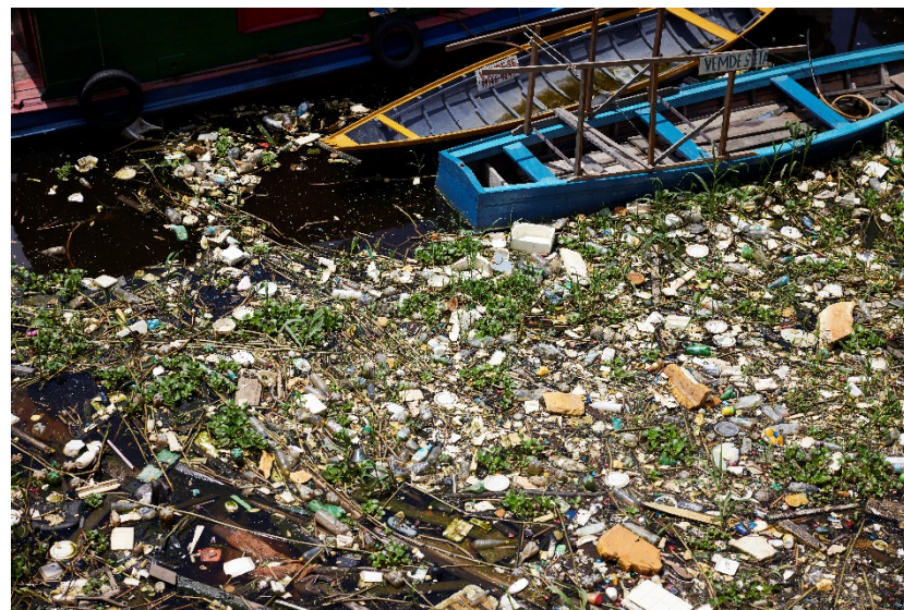
Río Negro, Manaus, Brasil.

Una gestión hídrica sostenible protege los ecosistemas y fortalece la resiliencia frente al cambio climático. La gestión integrada del agua debe incorporar la protección de cuencas, el tratamiento de aguas residuales y su reutilización bajo un enfoque de economía circular (UNESCO, 2015). Las organizaciones comunitarias