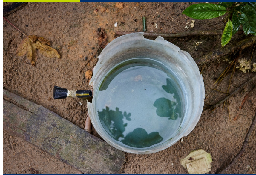
Comunidad Nova Vida, Manaus, Brasil © Habitat for Humanity International/Carolina Guerrero.

de las muertes por diarrea en LAC en 2016 estuvieron vinculadas a la ausencia de servicios adecuados de agua y saneamiento (CAF, 2023).