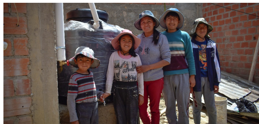
Alpacoma, La Paz, Bolivia.

En la práctica, son las propias familias quienes deben destinar tiempo, trabajo voluntario y recursos para cubrir funciones que corresponden a la responsabilidad estatal.