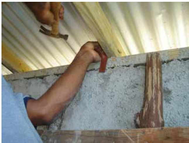
Colocación de refuerzos ante huracanes para asegurar los techos; en el marco de la iniciativa BRACED en Marlie Hill. ADRA Jamaica es nuestro socio implementador en el país.

Este proceso abarcó tres períodos de respuesta. Después del huracán Iván, se realizó un seguimiento en 2008 por el socio Alimentos para los Pobres y en el 2010 se hizo una intervención final junto con ADRA Jamaica y la Cruz Roja de Jamaica.