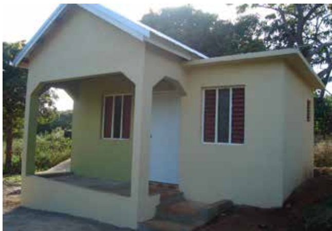
Vivienda de una habitación construida por ADRA Jamaica bajo el proyecto BRACED-BESTMAN.

Durante 2004-2006, Hábitat Internacional comenzó el proyecto con Hábitat Jamaica y después de que la organización dejó de funcionar, se hizo cargo del proyecto completo. Los deberes de Hábitat incluyeron la selección de las familias, la compra de materiales, la contratación de mano de obra especializada y la gestión de proyectos.