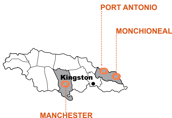
GRÁFICO DE UBICACIÓN DEL EVENTO :

El Huracán Iván, una de las peores tormentas tropicales que se han registrado en Jamaica, causó un daño significativo, dejó a miles de personas sin hogar y murieron unas 17 personas. Todavía se sienten los efectos de la tormenta y la situación se vio agravada por tormentas posteriores.